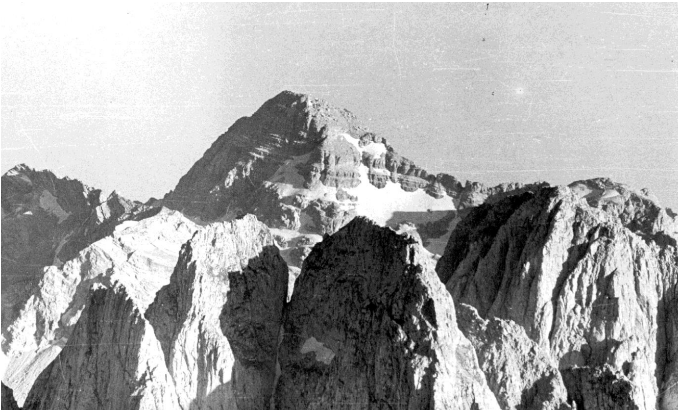
Језерски врх – Маја Језерцес

Североисточна страна планине, над Застаном, зове се Роман, и овај назив свакако није албански, већ црквено-словенски, јер су по Св. Роману (слави се 29. августа и 1. децембра) добијали име и многи монаси, а то је било и често име код наших предака. То име налазимо и код Руса, Пољака и Словенаца.